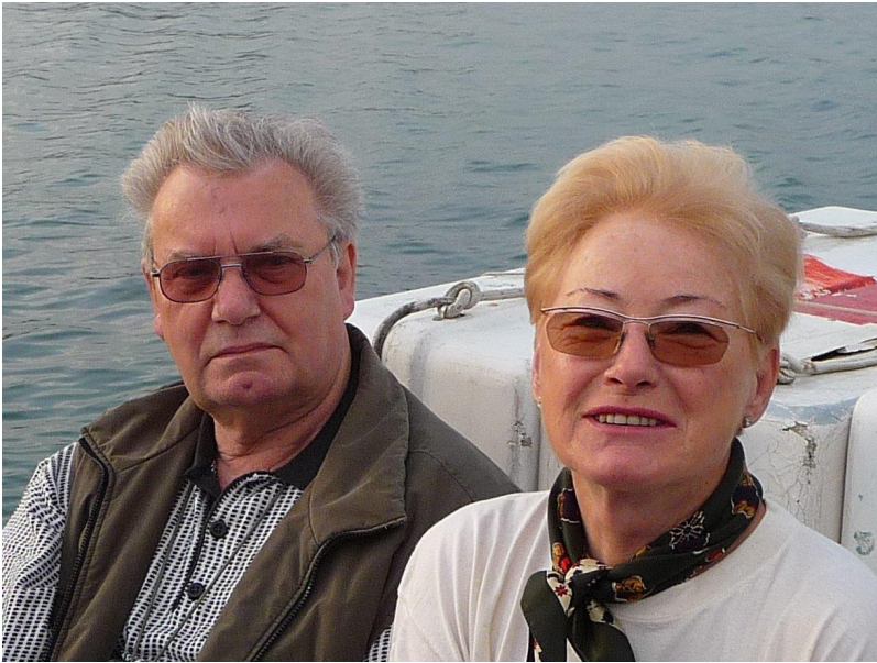
2008 mit XYL in Venetien