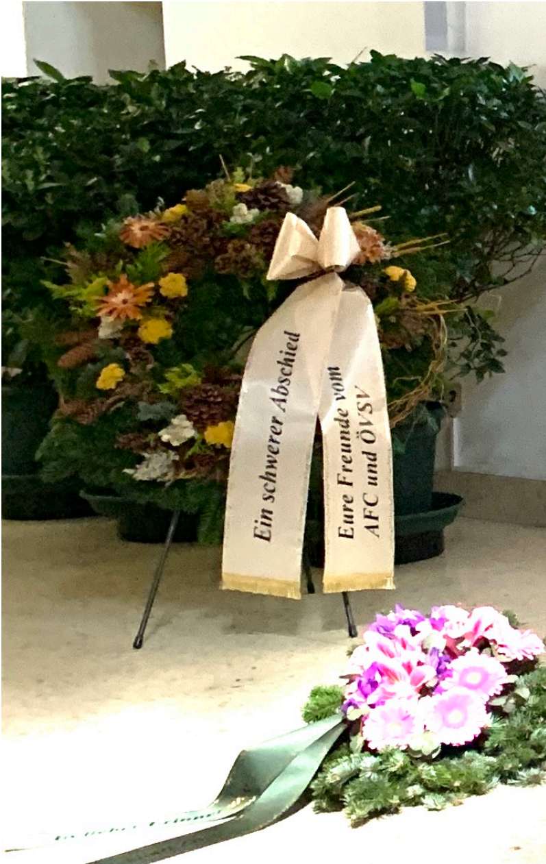
Unser Kranz zum Abschied