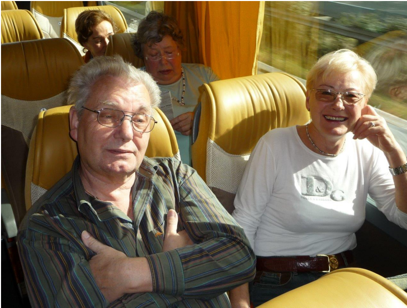
2008 mit XYL in Venetien